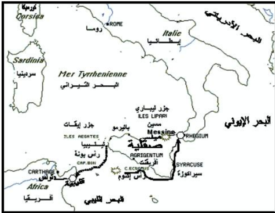
خريطة رقم 1: اهم معارك الحرب البونية الاولى 264-241 ق.م